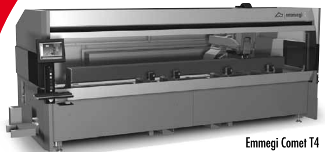
Emmegi Comet T4