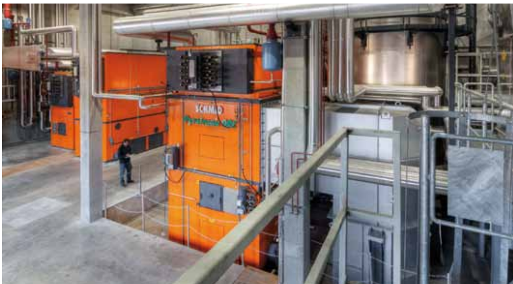
Holzfeuerungsanlagen von Schmid werden mit Unterstützung der ERP-Software von Abacus produziert.

Der Vorteil einer Komplettlösung, wie sie bei Schmid eingesetzt wird, liegt auf der Hand: Ein Verzicht auf Schnittstellen in andere Abteilungen wie den Einkauf und die Fertigungsplanung gewährleisten über die gesamte Prozesskette eine hohe Qualität und eine schnelle Verfügbarkeit der Daten. Diese müssen nur noch einmal erfasst werden. «Damit minimieren wir mögliche Fehlerquellen und sparen viel Geld», erzählt Kägi. Gerade bei einem international tätigen KMU mit einer Exportquote von 60 Prozent und Kunden in Europa mit Ländern wie Deutschland, England, Italien und Frankreich, aber auch in Südamerika und Asien wie in Chile und Japan ist eine transparente Kontrolle der Abläufe im Unternehmen von zentraler Be-