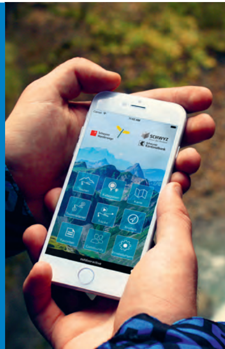
Auch der Tourismus wird immer digitaler.