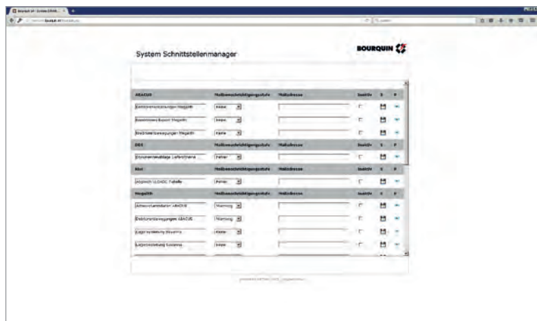
Im Schnittstellenmanager der OBT Datendrehscheibe können je nach Wichtigkeit die Benachrichtigungsstufen definiert werden.

Die Aufgabenstellung bei Bourquin ist komplex. So umfassen die Branchenlösungen unter anderem verschiedene Nebenbuchhaltungen, die Lagerbewertungen sowie die Zahlungs- und Kreditinformationen der Kunden. In der Abacus-Finanzbuchhaltung sind wiederum alle Rechnungsdaten gespeichert. Entsprechend müssen bei der Abwicklung eines Auftrags immer wieder Daten miteinander ausgetauscht werden.